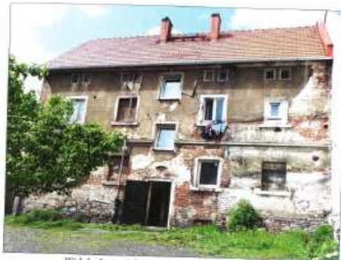
Widok elewacji frontowej – ul. Zgorzelecka nr 20.

na sprzedaż lokalu mieszkalnego Nr 1, znajdującego się w budynku położonym w Lubaniu przy ul. Zgorzeleckiej 20 wraz z udziałem we współwłasności nieruchomości gruntowej (działka nr 37, AM 1, Obręb III o powierzchni 102 m 2 , JG1L/00016334/5)