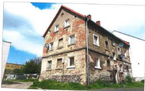
Widok budynku – ul. Zgorzelecka nr 20.